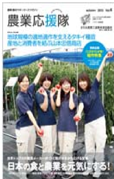
農業・農村・農業女子サポーターズマガジン「農業応援隊」に、本研修会が掲載されます。