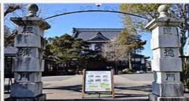
正門（道徳門と経済門）